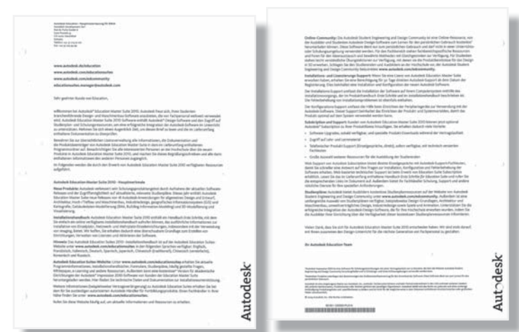
Allgemeine Informationen zur Suite